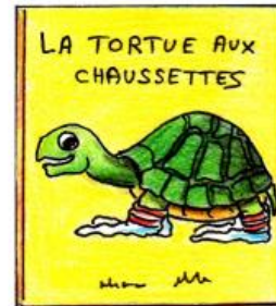
• UN ALBUM