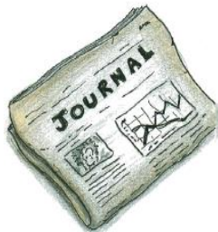
• UN JOURNAL