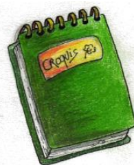
• UN CARNET