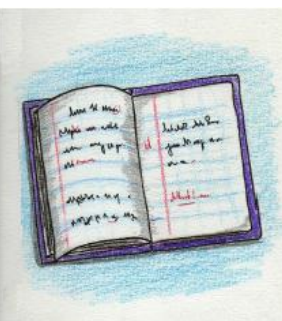
• UN CAHIER