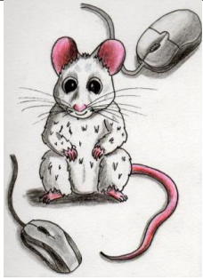
• UNE SOURIS