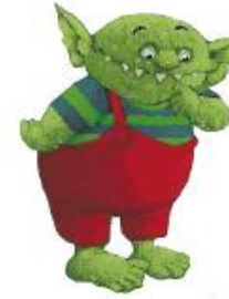
• LE PETIT OGRE