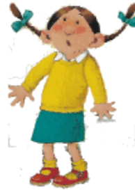
• UNE FILLE