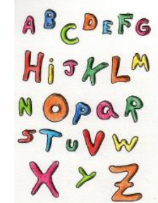
• UN ALPHABET